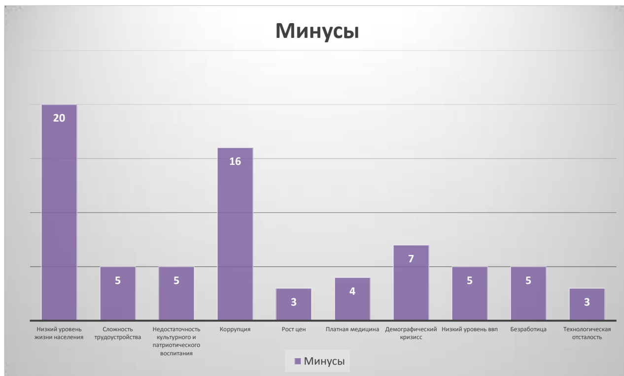
Рисунок 3 - «Минусы»

Когда проводился анализ минусов российского государства был отмечен тот факт, что государство уже фактически смирилось с этими минусами и почти ничего не пытается сделать с ними или же даже если и пытается, то ее усердия слишком малы. С учетом тех политических событий, которые пришлось на долю российского государства, вводом санкций и запретом на ввоз и вывоз отечественной продукции уровень жизни населения резко упал, что привело к ряду следующих негативных аспектов.