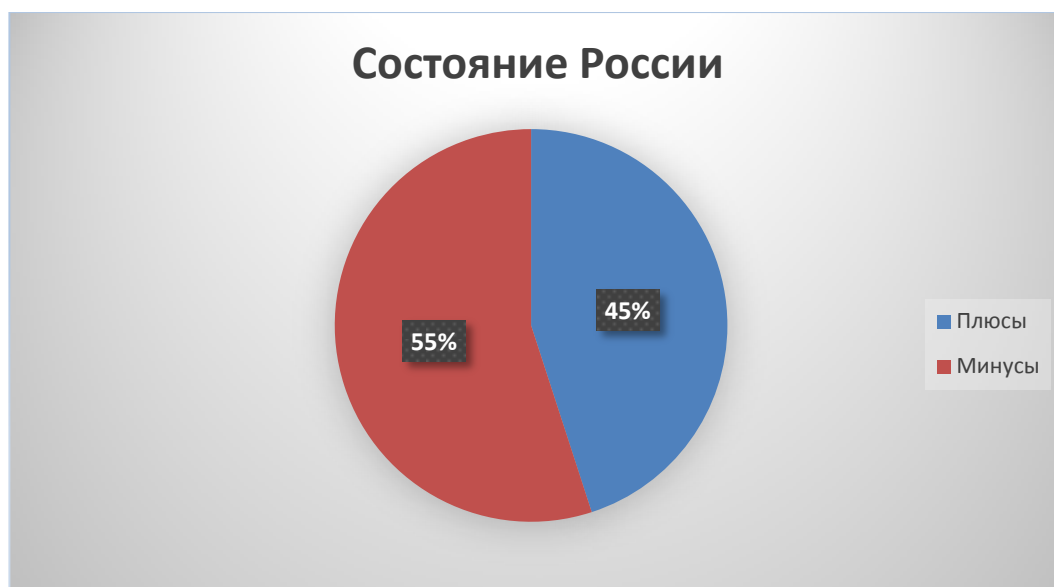
Рисунок 1 - «Состояние России»

В 2017 году Донской Государственный аграрный университет провел среди учащихся социологический опрос на выяснение волнующих студентов проблем в государстве и определения состояния России. В опросе приняли участие 50 человек. Им предстояло определить положительные и отрицательные стороны Российского государства. Результаты данного опроса приведены на рисунке 1.