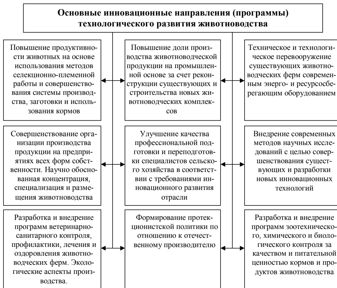
Рис.3 Схема технологического развития животноводства

Индекс уровня технологического развития как отдельных мясопроизводящих отраслей животноводства, так и мясного подкомплекса сельского хозяйства в целом, является оценкой технологической составляющей производства и должен обязательно сопровождаться экономическими показателями (валовое производство мяса, себестоимость, рентабельность и др.).