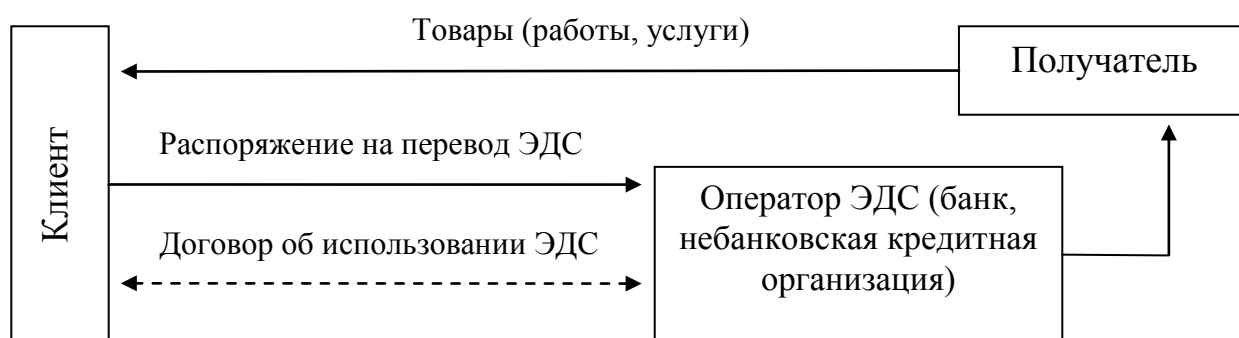
Рисунок 2 - Схема взаимоотношений сторон при переводе электронных денег по распоряжению клиента получателю